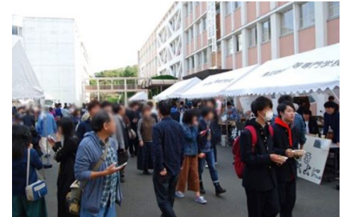
— 海学祭 —