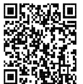
申込 QR コード

締切: 11月28日(木) なお、先着順に優先されますのでご了承ください。 入試問題解説は申し込みなしの飛び込み受験も受け付けます。