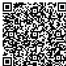
申込 QR コード

※2 授業、部活については当日の開講・活動状況によりしますので、ご希望のものをご覧いただけない可能性がございます。あらかじめご了承のほどお願い申し上げます。