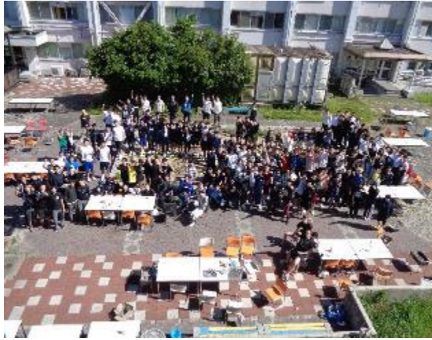
去年のバーベキュー大会の様子