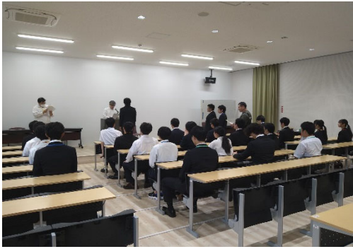
校長が寮長へ認証状を渡す様子=5月31日