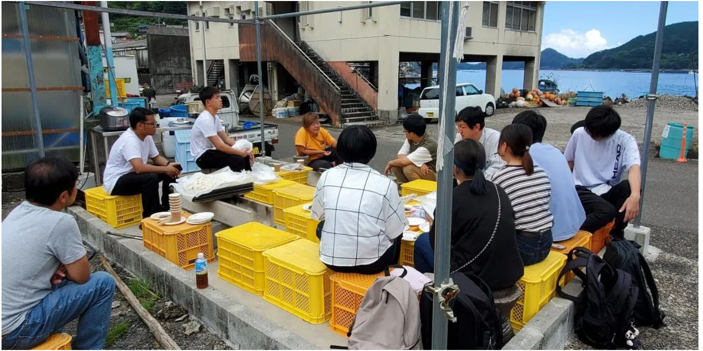
定置網漁師の方との懇談会の様子

最終日の14日にはそれぞれのチームから、ビジネスプランの発表会を実施しました。発表会では、定置網の漁獲予測を行い漁業者が閲覧するアプリ開発や、発酵食品の販売をめざしてパンを作っているグループからは未利用魚をフィッシュバーガーにして学校給食として提供する「地パン地消」、磯焼けの原因となっているムラサキウニを畜養し、高級食材として提供するアイデアが披露されました。