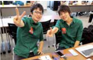
プレゼンを終えて一息ついたところ

このコンテストを通してプログラミング能力を大きく向上させることができました。これからもコンテストに参加し、経験を積んでいきます。