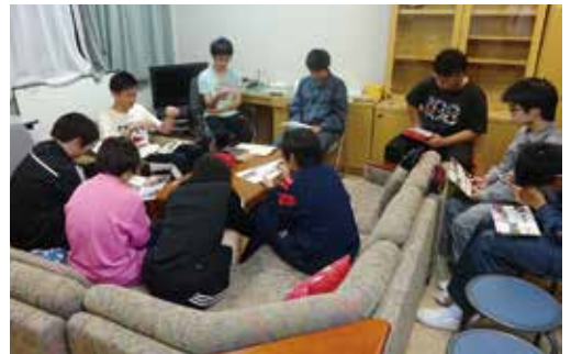
寮内読書会の様子

手な子もいます。簡単な多読教材を使って、英語に親しみ、苦手意識を無くせるように、分かりやすい説明を心掛けています。