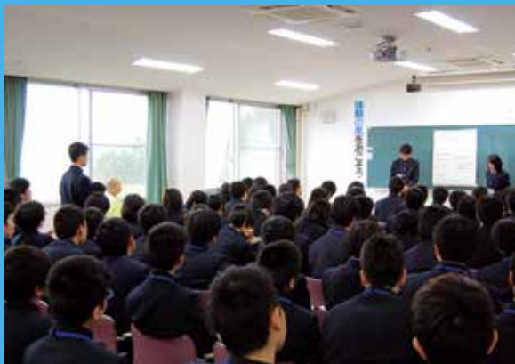
新入生オリエンテーション