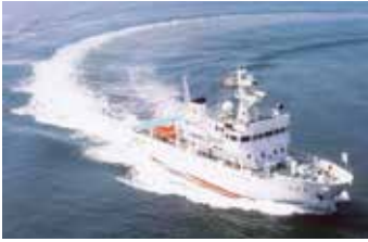
本校の練習船「鳥羽丸」

商船学科の学生に特に望むことは、学業を通じて海事技術者になるための基礎を作ることです。特に低学年は、基礎科目（英数国理社など）を、毎日勉強する習慣を身に付けてください。課外活動などで体を鍛え、日々元気に過ごしてもらいたいと思います。