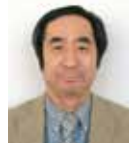
商船学科航海コース主任