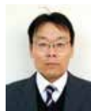
電子機械工学科長