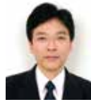
商船学科・機関コース主任