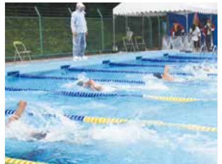
高専大会開催中の様子

大会が終わった9月～10月は練習とレクリエーションに戻り、泳ぐのに適した温度でなくなった時期から（今年は10月末まで泳いでおりました）筋トレやランニングといった陸上トレーニングに移ります。冬季でも、1か月に1回、鈴鹿市にある「鈴鹿スポーツガーデン」（温水プール付）へ練習に出かけて