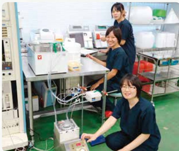
医用工学実験室で大学院生の仲間と筆者（手前）

るため苦しいことも多いですが、その先にある「成長」を目指し、私はこれからも取り組んでいきたいと思っています。私は博士の学位取得を目指し、来年度よりさらに進学しますが、向上心を忘れずに前進し続けていきたいと思っています。