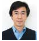
制御情報工学科長